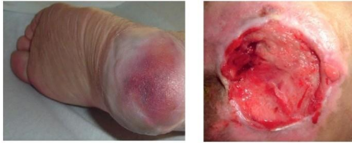
Lesão por pressão em região do calcâneo ( calcanhar ) e sacrococígeo ( cóccix )

Lesão por pressão são machucados que aparecem na pele quando o corpo fica em uma mesma posição por muito tempo. As figuras acima demonstram dois tipos de lesão.