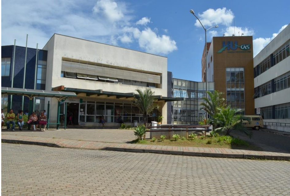
HU-UFJF - unidade Dom Bosco

O Hospital Universitário da Universidade Federal de Juiz de Fora (HU-UFJF/ EBSEH) é uma instituição pública de saúde, com atendimento 100% SUS, com 51 anos de existência, possuindo três unidades na cidade de Juiz de Fora - MG: Santa Catarina, Dom Bosco e o Centro de Atenção Psicossocial (CAPS).